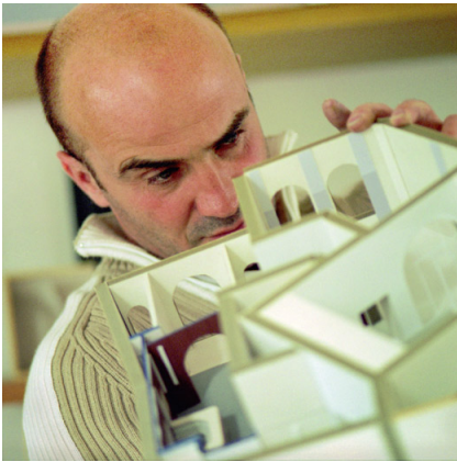
Modellstudie: Umbau und Instandsetzung Hotel Victoria.

Ich empfinde Respekt für die Kunst des Fügens, für die Fähigkeit der Handwerker und die Ingenieure. Mich beeindruckt das Wissen der Menschen über die Herstellung von Dingen, die in ihrem Können enthalten ist. Darum versuche ich, Bauten zu entwerfen und weiterzuentwickeln, die diesem Wissen gerecht werden und es auch wert sind, dieses Können herauszufordern. Diese geschaffende Qualität verbindet und schafft Vertrauen in unsere drei Kernkompetenzen: Im Bestand bauen, In Stand setzen und Neu bauen.